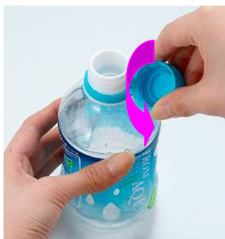
①キャップを持ってひねる