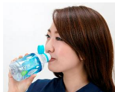
③キャップを持たずに飲める