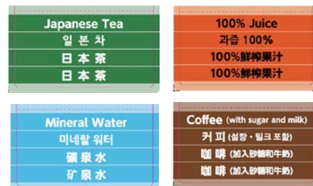
多言語表記 POP (一部)