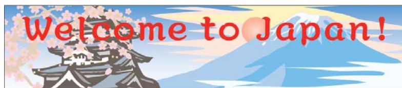
「welcome to Japan」コーナー (背景シート)

イベント実施に合わせて、自販機内に「Welcome to Japan」コーナーを設け、英語・中国語 (繁体/簡体)・韓国語の商品説明 POP を設置し、訪日観光外国人のお客さまにもお買い求め頂きやすい売場づくりを進めます。 展開開始：2月19日以降順次 展開台数：JR 東日本管内約 200 台程度