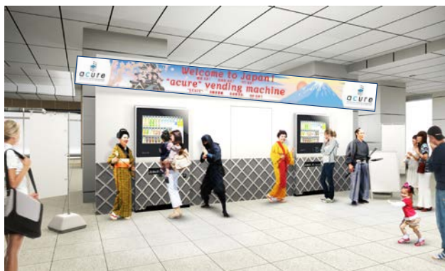
イベントブース (イメージ)