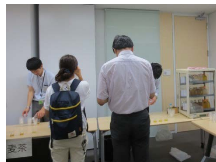
試飲会風景 2015年7月撮影

ホットでお飲みいただいた石川篇は、爽やかな香りで、コールドでも飲みたいとの声を一番いただいたため、第一弾として、暑さの残る9月発売といたしました。