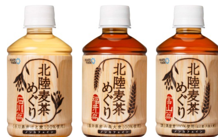
第一弾 石川篇 第二弾 福井篇 第三弾 富山篇 2015.9.15 発売 2015.11 発売予定 2016.1 発売予定