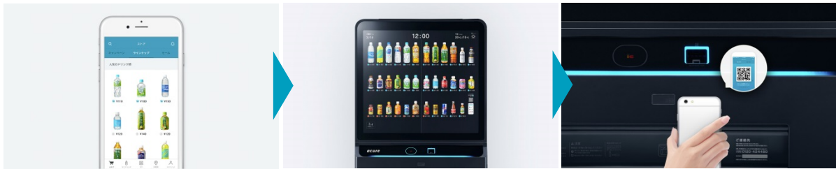
事前にアキュアパスで購入