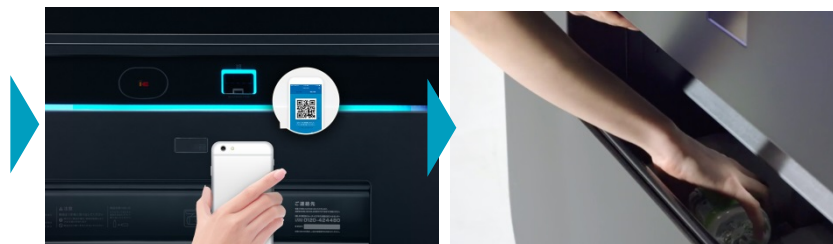
後払い受取のQRコードをかざす