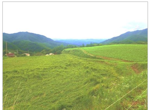
※日穀製粉グループ 農業法人「ファームめぶき」による韃靼そばの実の栽培の様子（長野県筑北村）

※ルチン・・・そばに含まれるポリフェノールが「ルチン」であり、同じ仲間には赤ワインのアントシアニンやお茶のカテキンなどがあります。