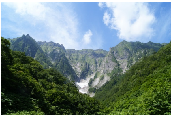
※画像は谷川岳の名所、「一ノ倉沢」