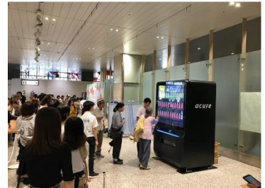
JR 大宮駅での関連イベントの様子(2018年9月16日)

公式 Facebook： https://www.facebook.com/acureofficial/