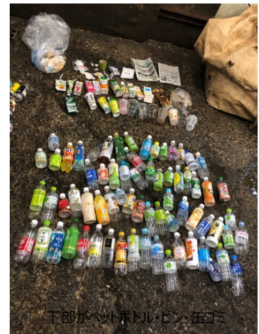
下部がペットボトル・ビン・缶 上部がそれ以外の一般ゴミ

エキナカの自販機横に設置されている回収ボックスでは、ペットボトル・ビン・缶以外の紙カップやビニール袋などの一般ゴミが30%以上含まれている場合もあるため、今回、回収ボックスの構造や啓蒙ステッカーのデザインを検討し、分別啓蒙・リサイクル推進を目的とした実証実験を実施することとなりました。3月上旬より回収ボックスの仕様を変更した『リサイクルボックス』を一部の駅で置き換える他、回収ボックスに啓蒙ステッカーの貼付を行い、お客さまの分別意識向上による一般ゴミの混入抑止に効果があるかを検証します。効果があつた場合は、今後リサイクルボックスの本格導入を検討し、サステナブルな社会の実現を目指していきます。