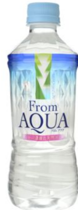
発売当初の大清水